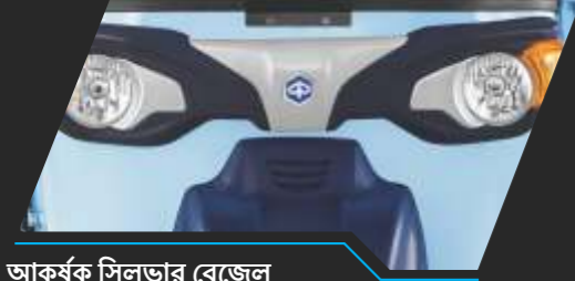
আকর্ষক সিলভার বেজেল