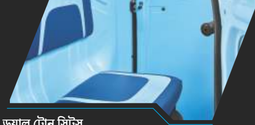
ডুয়াল টোন সিটস